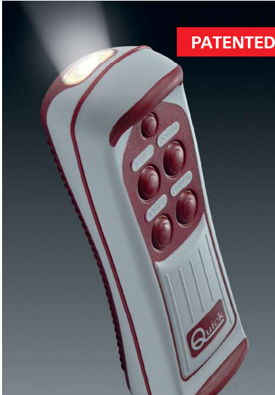
La torcia LED integrata è un'esclusiva Quick. The integrated LED light is an exclusive Quick feature.