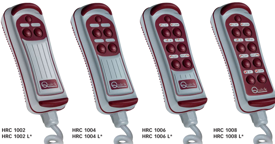
HRC 1002 HRC 1002 L*

(1) Su carico resistivo a 30 Vdc / On resistive load at 30 Vdc. (2) Escluso cavi in uscita sul retro della presa / Excluded output cables on the back socket