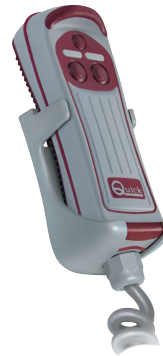
Staffa di supporto Support bracket